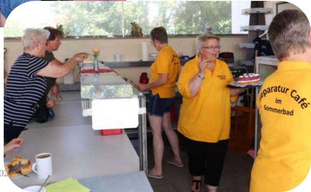
ASW Fotos 2022